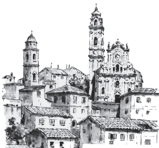
COMUNE DI CERVO